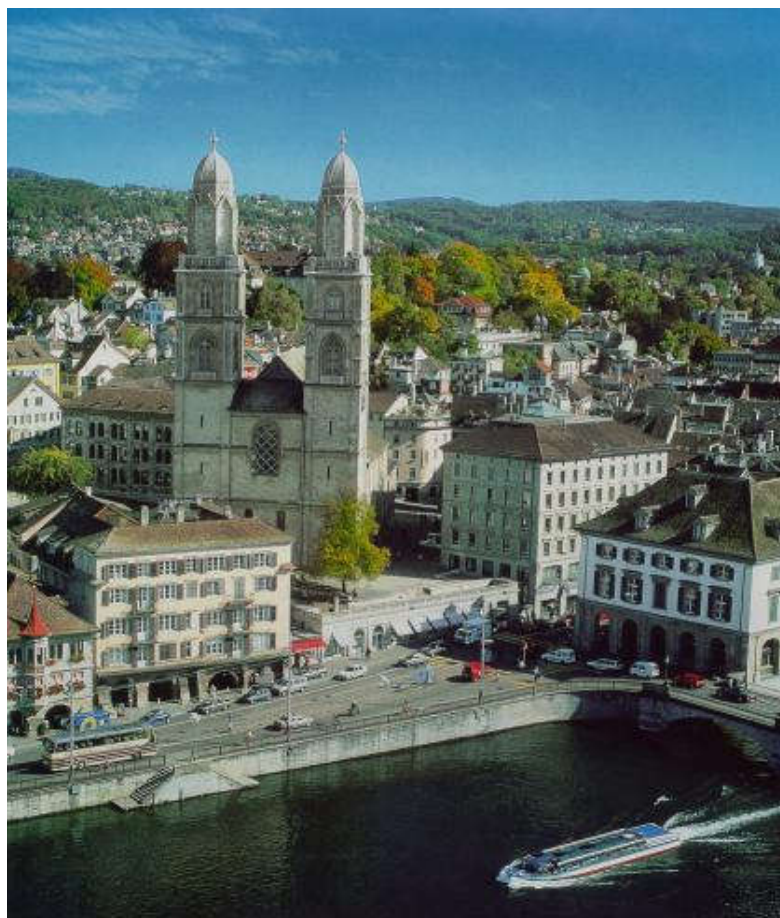
Blick aufs Grossmünster im Zentrum Zürichs