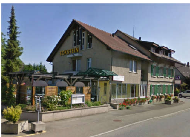
Restaurant Eckstein mit Terrasse